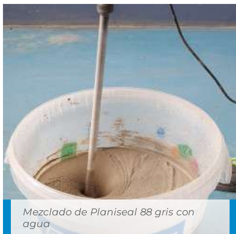
Mezclado de Planiseal 88 gris con agua

Las características de la capa endurecida de Planiseal 88 sólo permiten que sea utilizado exclusivamente para impermeabilizaciones rígidas. Planiseal 88 , aún siendo resistente a la abrasión y a las sollicitaciones típicas de eventuales sólidos presentes en los líquidos de las estructuras hidráulicas, no puede ser expuesto a ningún tipo de tránsito; si se aplica en un pavimento o en superficies sujetas a la caída accidental de objetos que puedan dañarlo, debe ser protegido con un recrido cementoso de unos 4-5 cm de espesor.