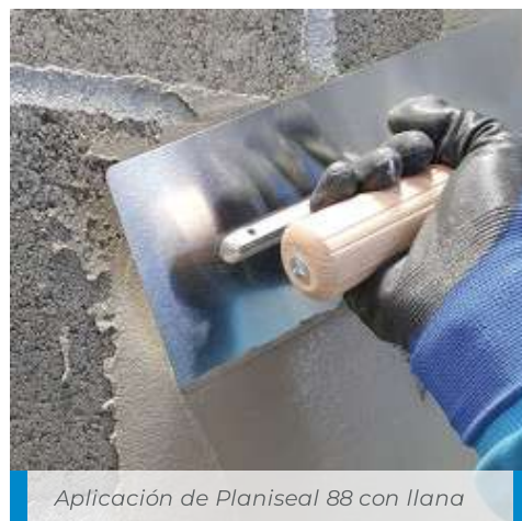
Aplicación de Planiseal 88 con llana