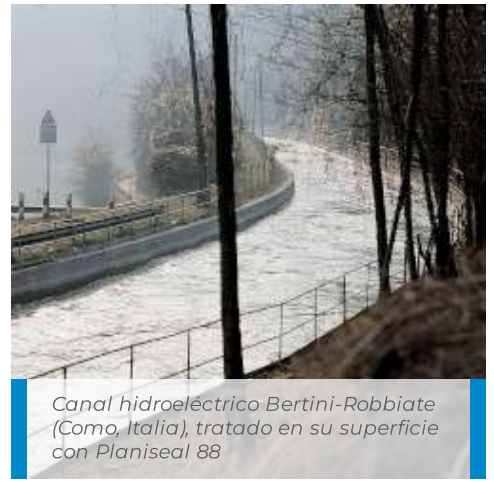
Canal hidroeléctrico Bertini-Robbiate (Como, Italia), tratado en su superficie con Planiseal 88