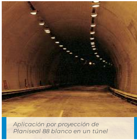
Aplicación por proyección de Planiseal 88 blanco en un túnel