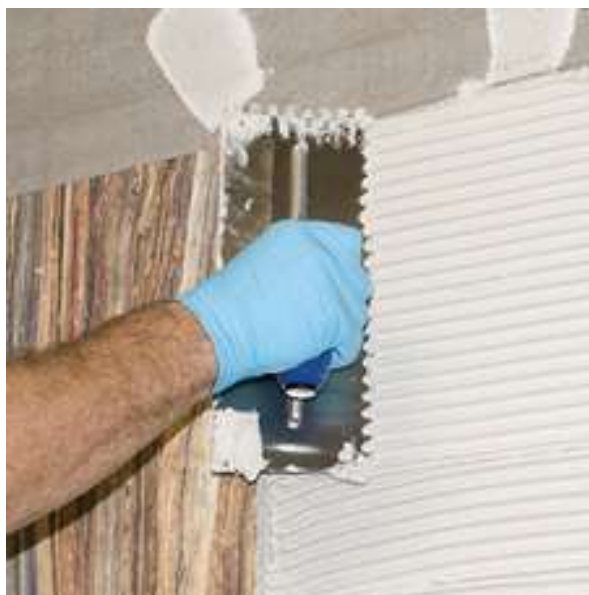
Aplique el mortero en una sola dirección con el lado dentado de la llana