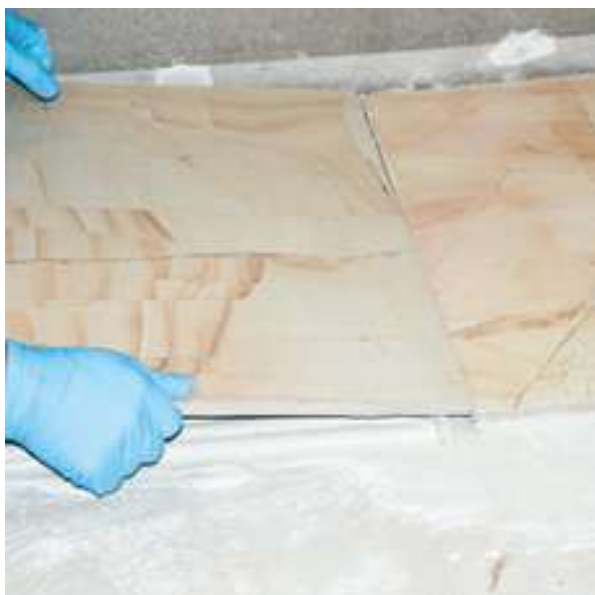
Diseñado especialmente para porcelanatos